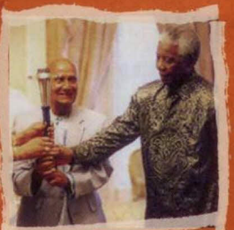
Nelson Mandela, nositel Nobelovy ceny míru