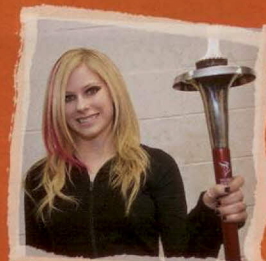
Avril Lavigne, kanadská zpěvačka