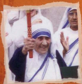
Matka Tereza, nositelka Nobelovy ceny míru

Každý z nás má v sobě plamen naděje – touhu po lepším světě a šťastnější budoucnosti. S každým předáním pochodně harmonie z ruky do ruky se tento plamen naděje šíří od srdce k srdci, po celém světě. Běžet s pochodní či s ní ujít jen pár kroků a vložit do ní své přání pro lepší svět může každý. Mnoho významných osobností z celého světa se právě tímto způsobem každoročně do štafety zapojuje.